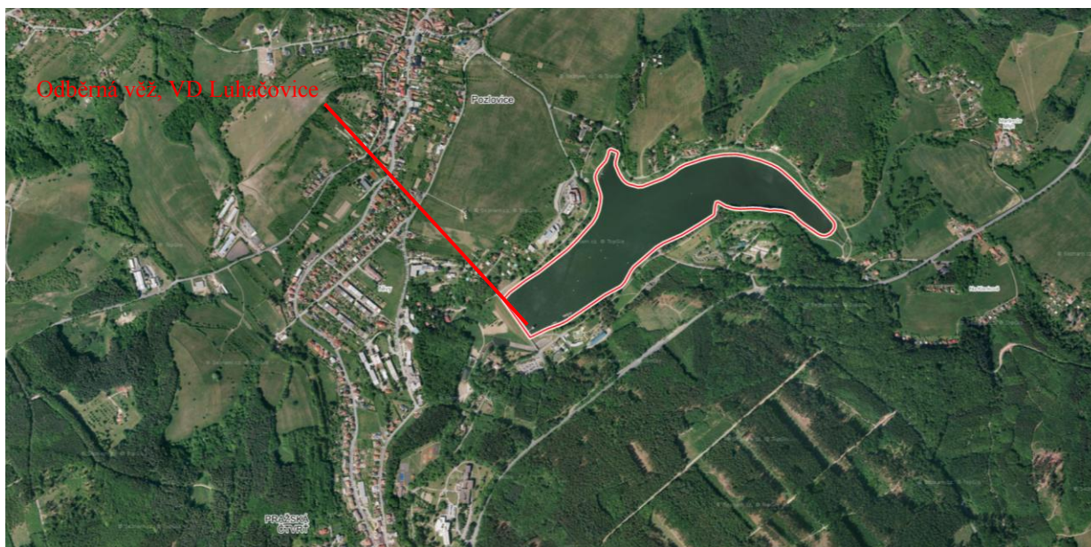
Letecký snímek s odběrné věže VD Luhačovice